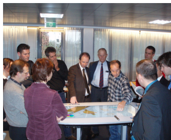
Met behulp van een mactable worden tegengestelde belangen bespreekbaar